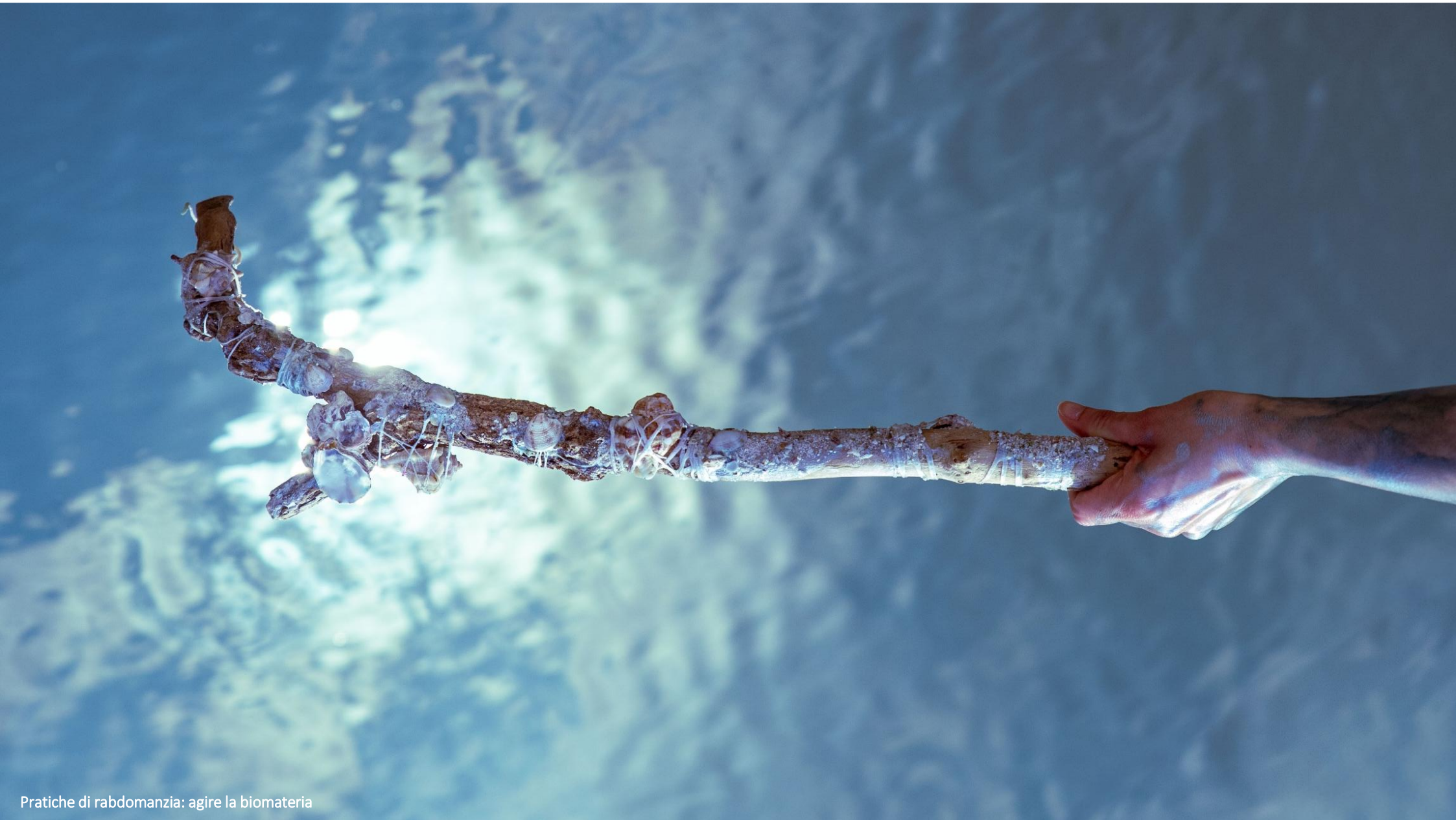
Pratiche di raddomanzia: agire la biomateria