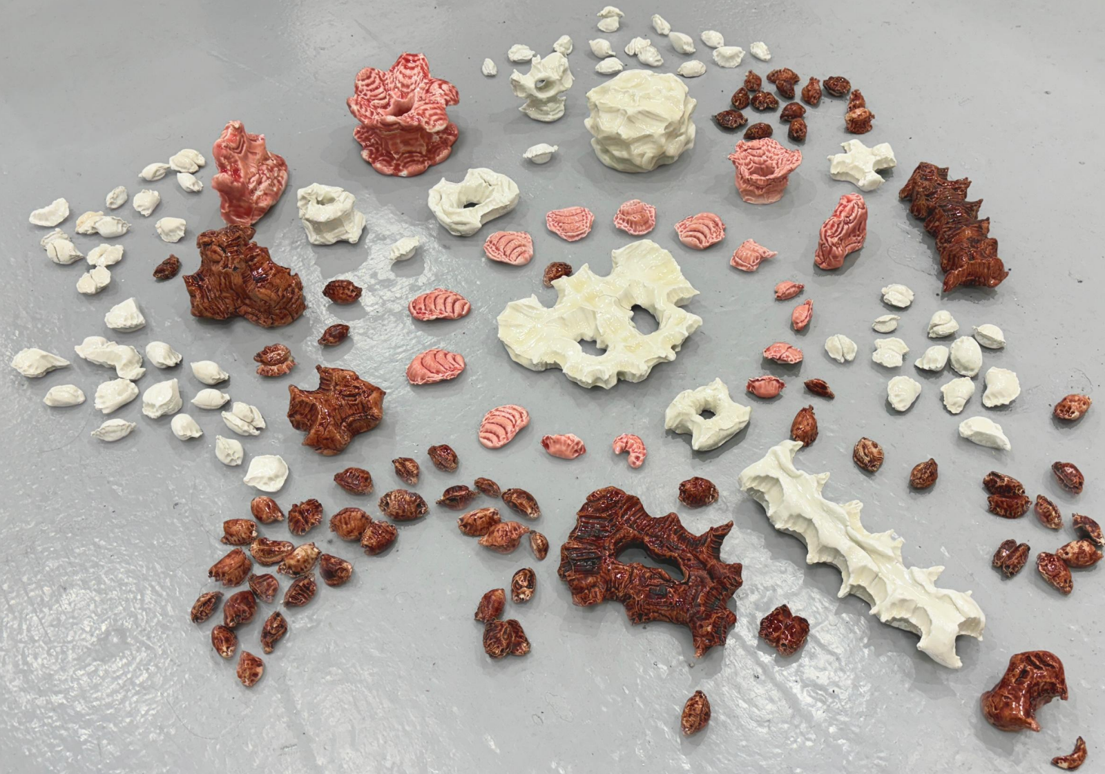
New bones from the scoria