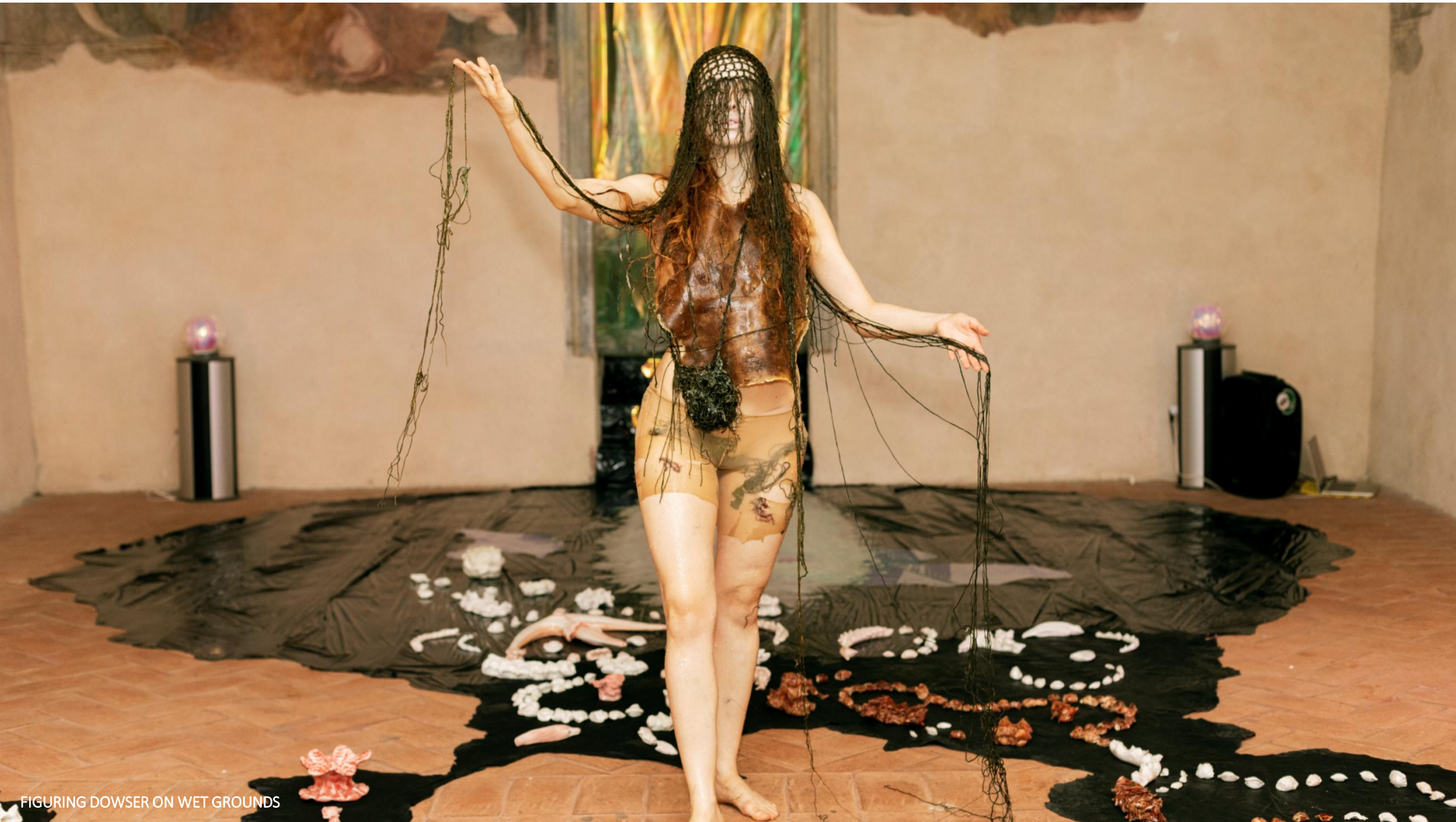
FIGURING DOWSER ON WET GROUNDS