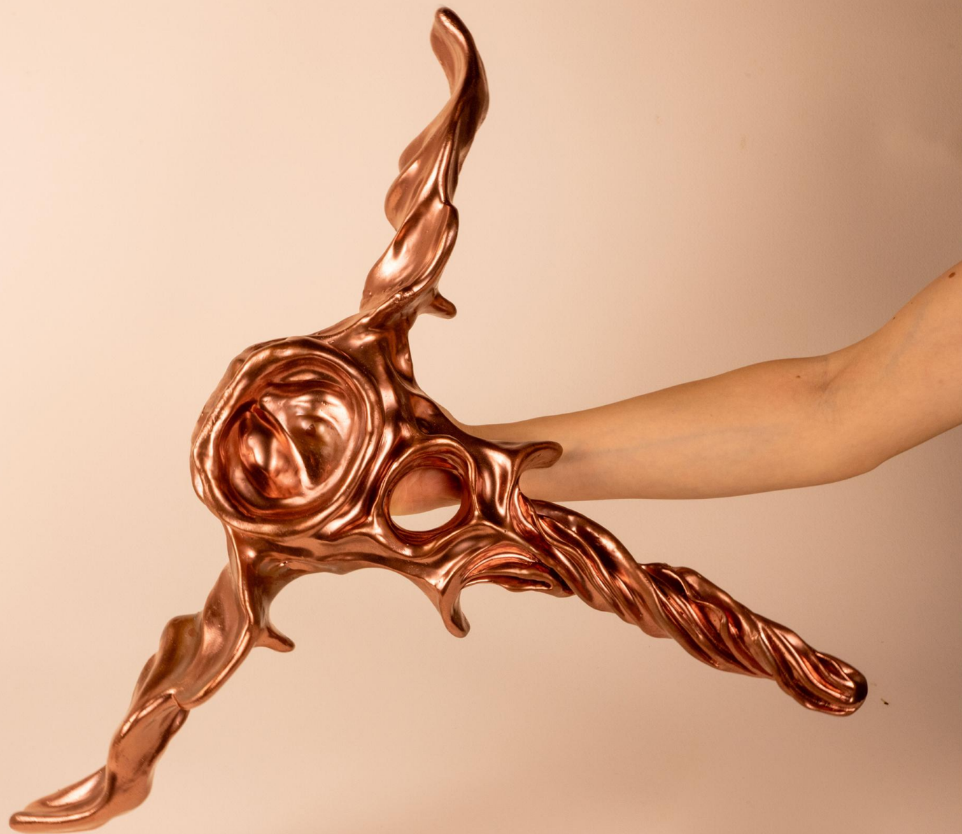
Dettaglio di una scultura in ceramica. Detail of a ceramic sculpture.