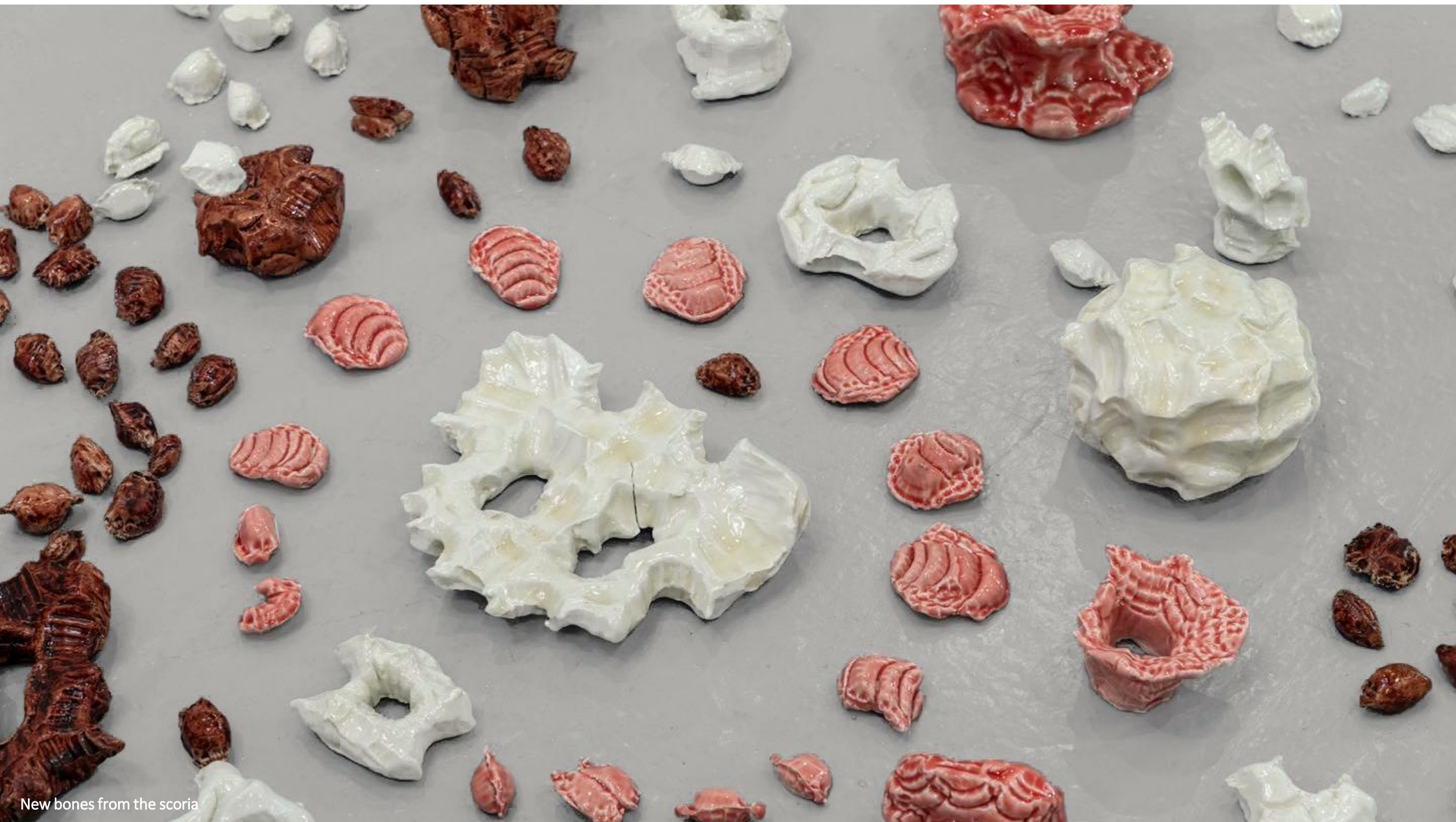
New bones from the scoria