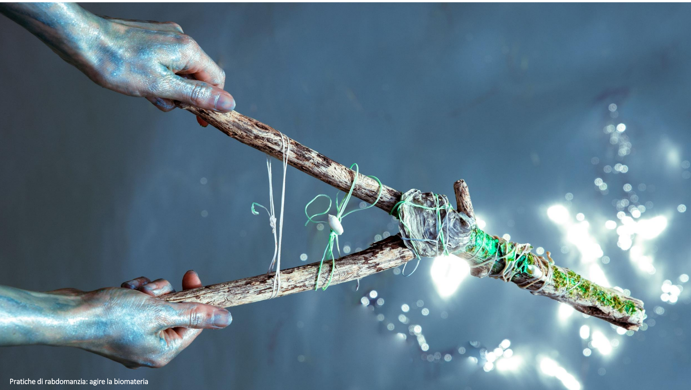
Pratiche di raddomanzia: agire la biomateria