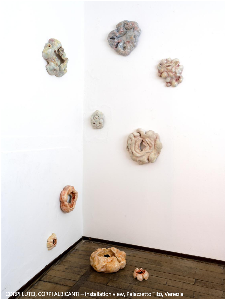
CORPI LUTEI, CORPI ALBICANTI – installation view, Palazzetto Tito, Venezia